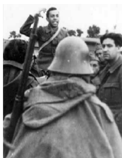
Miguel Hernández al front

El cop d'estat de 1936 contra el govern de la República enfrontarà Espanya en dos bàndols, i els poetes -com la resta de ciutadans- es veuran afectats per l'huracà bèl·lic: uns lluitaran al front, altres recolzaran el govern o els rebels com a ambaixadors o secretaris, altres escriuran per animar els combatents, difondre ideologies; contribuir, en resum, a la lluita amb la seva ploma.